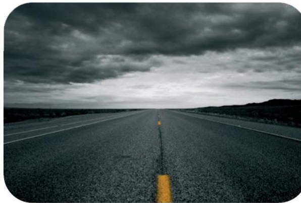
Ο άλλος Δρόμος