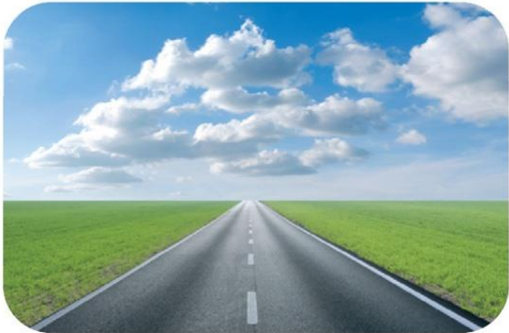
Ο Δρόμος της Logistics Way